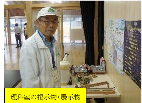
理科室の掲示物・展示物