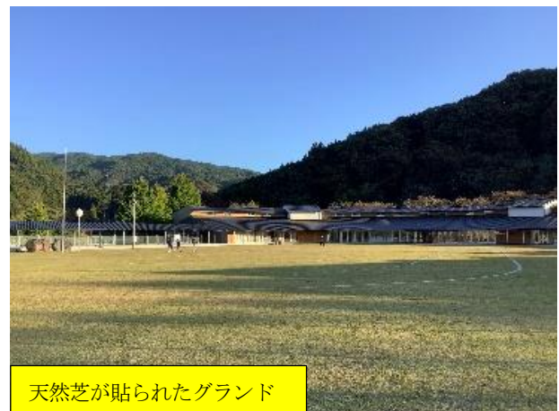
天然芝が貼られたグラウンド