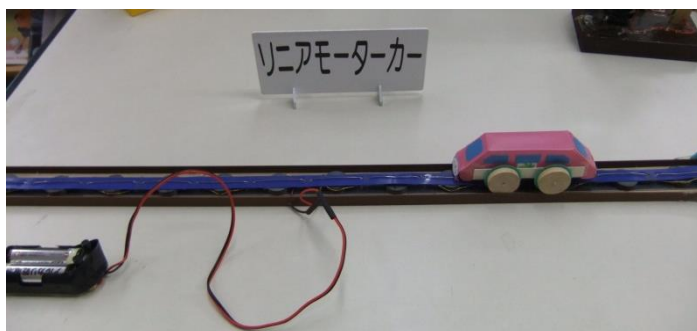
完成したリニアモーターカー (レールの長さは 60 cm)

「工作体験教室はとてもおもしろく、5 回ぐらい参加しています。一番良かったのは、電気自動車作りです。電気を充電させて、自動車が走り出した時はとてもうれしかったです。リニア中央新幹線が開通したら、ぜひ乗りたいです。」と、目を輝かせて答えてくれました。新山君は、もの作りが好きで、授業の中では理科が好きな教科の 1 つだそうです。将来が楽しみです。ちなみに、「将来は何になりたいですか。」という質問に、新山君は、「料理人。それもイタリア料理の料理人です。」と、力強く答えてくれました。目標を持って将来に向かって自分の夢を羽ばたいてほしいですね。