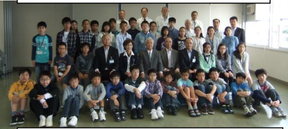
数学クラス 1年23名 2年8名 3年4名